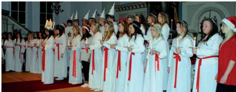
40 ungdomar från Åsaskolan och Åsa kyrkokör bjöd på en vacker och charmfull luciakonsert i Ölmevalla kyrka.

Varje år arrangerar Åsa Lions, Åsaskolan och Landa-Ölmevalla församling tillsammans bygdens luciafirande. Det har blivit en kär tradition. 2007 års Luciafölje från Åsaskolan och Åsa kyrkokör bjöd på en alldeles underbar konsert i Ölmevalla kyrka och som vanligt var kyrkan fullsatt.