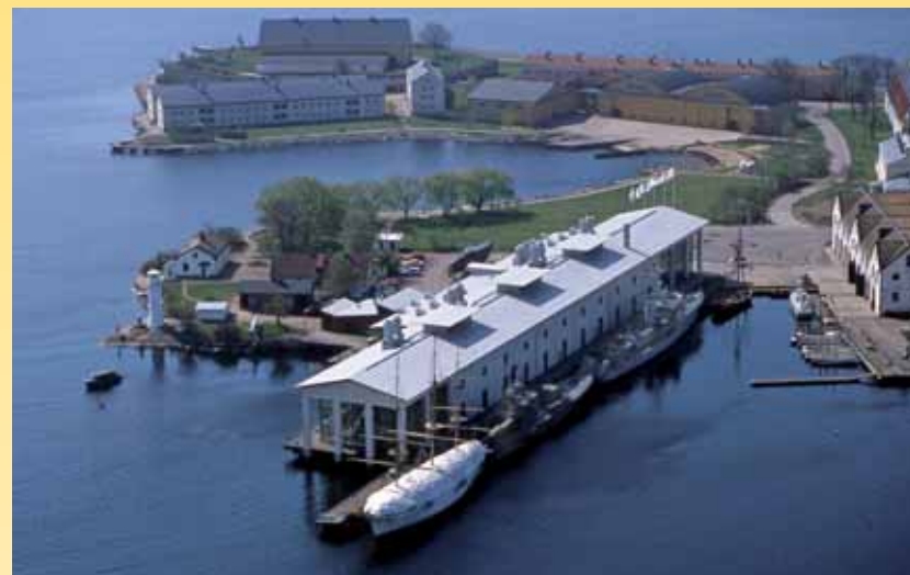
Marinmuseet i Karlskrona.

Som redan bestämdes vid förra årsmötet i Linköping, äger 2009-års årsmöte rum i Karlskrona. Årsmötet äger rum på Marinmuseet i Karlskrona.