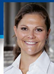
Beskyddare: HKH Kronprinsessan Victoria